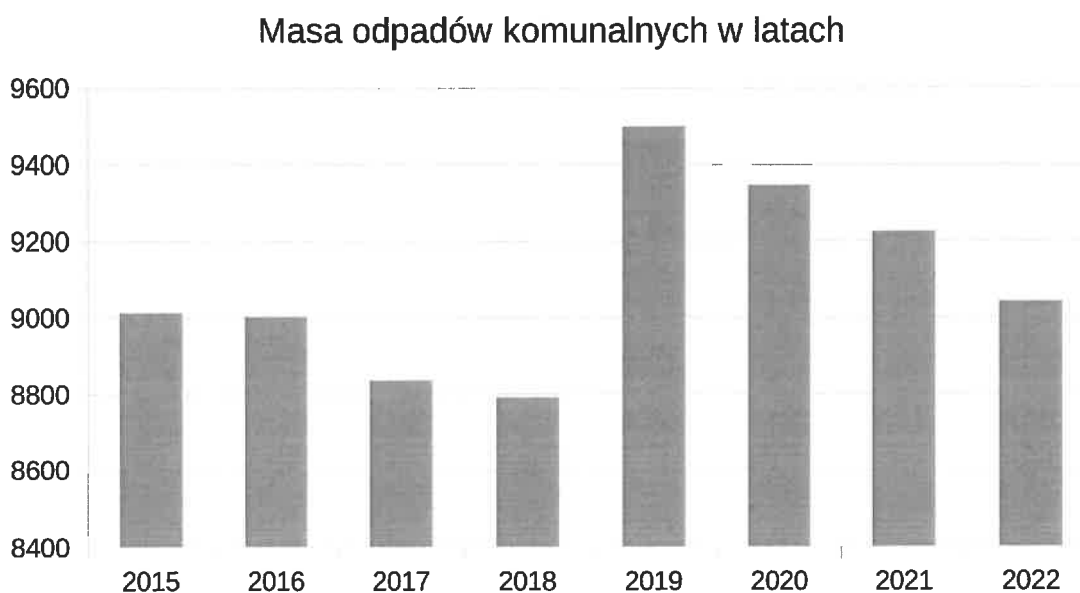
Wykres 2.: Masa odpadów komunalnych w poszczególnych latach dla miasta Nowa Ruda.

Na terenie Gminy Miejskiej Nowa Ruda nie ma możliwości przetwarzania odpadów komunalnych. Niesegregowane (zmieszane) odpady komunalne przekazywane były do instalacji do mechaniczno-biologicznego przetwarzania zmieszanych odpadów komunalnych w Ścinawce Dolnej oraz Bielawie. Pozostałe odpady komunalne, zebrane selektywnie przekazywane były do instalacji odzysku i unieszkodliwiania odpadów zgodnie z hierarchią postępowania z odpadami. W roku 2022 zlikwidowano 32 tzw. „dzikich wysypisk” i zebrano z nich 40,1 Mg odpadów.