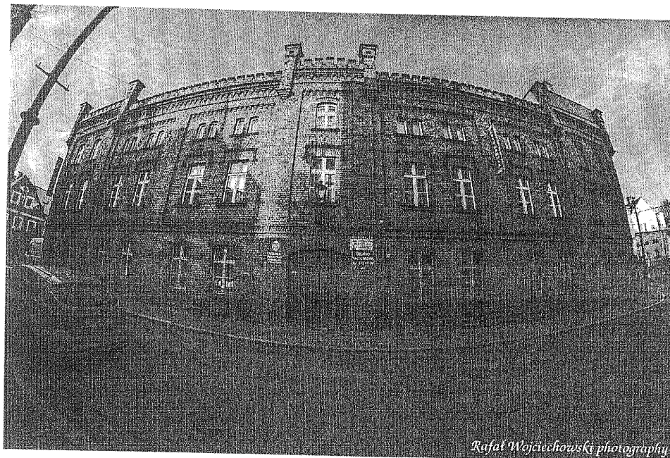
Główna siedziba biblioteki przy ul. Boh. Getta 10

Noworudzka księżnica wykorzystuje elektroniczne technologie w zakresie tworzenia i udostępniania baz danych (katalogowych, bibliograficznych i faktograficznych), rejestracji czytelników i wypożyczeń, udostępniania Internetu.