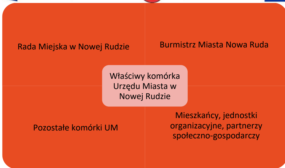
Rysunek 2. Podmioty zaangażowane w zarządzanie strategią