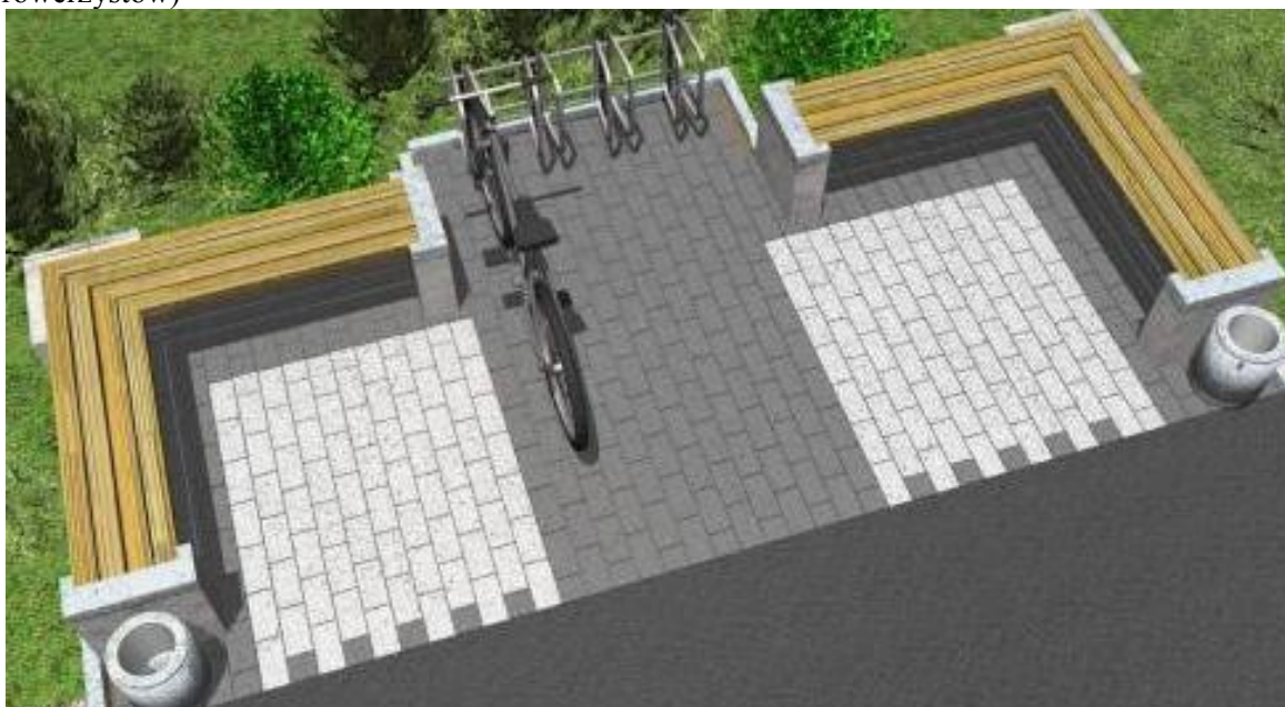
Przykładowe miejsce odpoczynku dla pieszych i rowerzystów wraz z przykładowym rozmieszczeniem ławek, stojaka na rowery, koszy na śmieci)