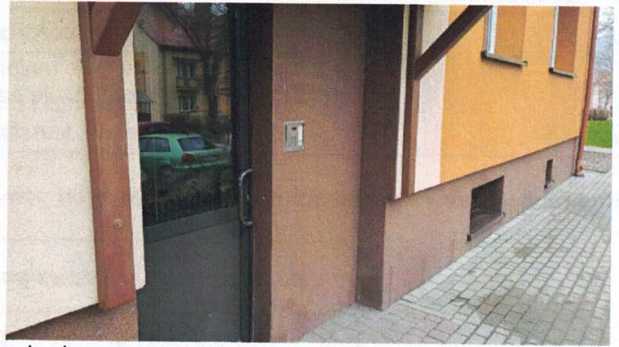
Fot. 1-6 Budynek, klatka schodowa oraz otoczenie